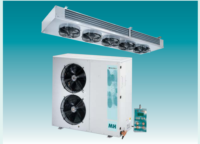
Серия сплитсистем с двухпоточным потолочным воздухоохладителем